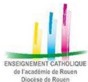
ENSEIGNEMENT CATHOLIQUE de l'Académie de Rouen Diocèse de Rouen