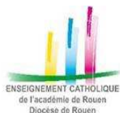
ENSEIGNEMENT CATHOLIQUE de l'académie de Rouen Diocèse de Rouen