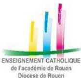
ENSEIGNEMENT CATHOLIQUE de l'Académie de Rouen Diocèse de Rouen