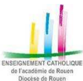
ENSEIGNEMENT CATHOLIQUE de l'Académie de Rouen Diocèse de Rouen