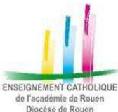
ENSEIGNEMENT CATHOLIQUE de l'Académie de Rouen Diocèse de Rouen