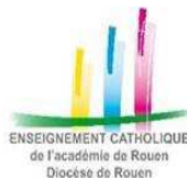
ENSEIGNEMENT CATHOLIQUE de l'Académie de Rouen Diocèse de Rouen