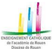
ENSEIGNEMENT CATHOLIQUE de l'Académie de Rouen Diocèse de Rouen