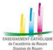
ENSEIGNEMENT CATHOLIQUE de l'Académie de Rouen Diocèse de Rouen